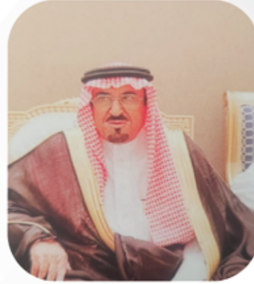
الرئيس التنفيذي ومالك الشركة اللواء.م/ راشد بن ظافر الهاجري