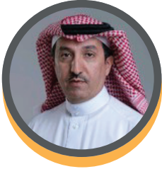
الدكتور/ فهد الشري البنك المركزي